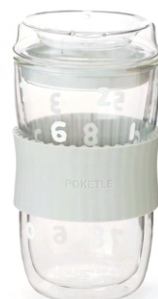
SOU・SOU×POKETLE vidro 330 ¥3,080 (税込)