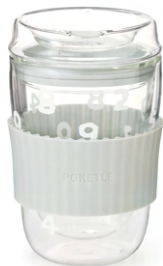
SOU・SOU×POKETLE vidro 220 ¥2,860 (税込)